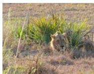
• Mal d'Africa