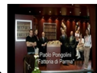
• Il più nobile dei salumi incontra il più nobile dei metalli