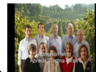
• "Cantine 4 Valli": passione per la musica e il buon vino