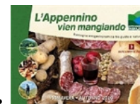
• L'Appennino vien mangiando. La rassegna enogastronomica tra natura e gusto nell'Appennino Parma Est