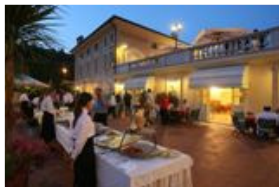
Festa d'Estate a La Montina

Franciacorta, ostriche e musica nella settecentesca cornice di Villa Baiana