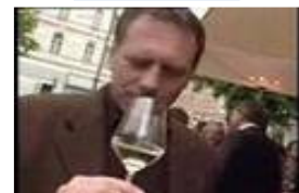
WEIN & CO Frühlingsfest 2...