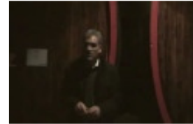
Im Keller der Meraner Wei...