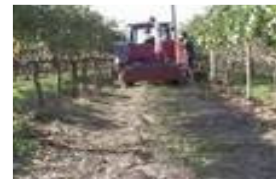
Vendemmia Azienda Agraria...